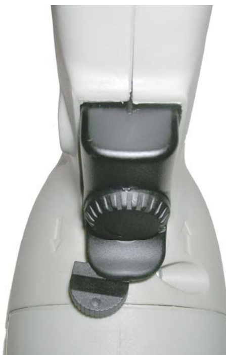
Рисунок 2. Положение переключателя направления вращения (реверс)

ВНИМАНИЕ! В целях предохранения вала гибкого с наконечниками от раскручивания переключатель направления вращения (реверс) на машине (см. паспорт 24.01.03.00.00 раздел 4) должен быть перевернут в положение, задающее вращение шпинделя в правую сторону (по часовой стрелке), смотреть рисунок 2.